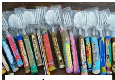
マイスプーン・フォーク