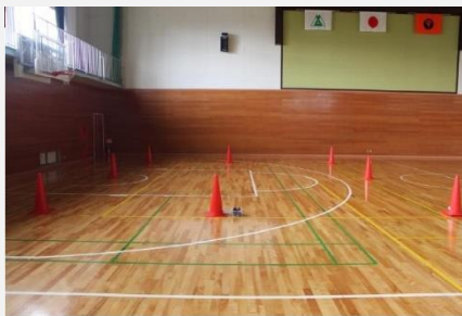
ブラインドウォーク