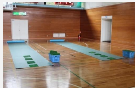
ステッピングストーン