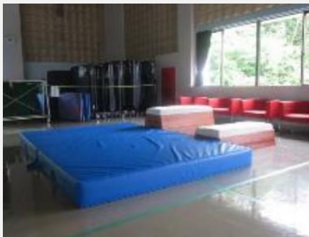
友情のバックフライング